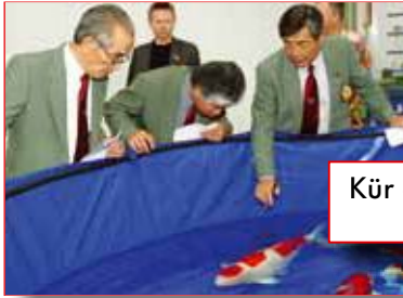
Kür der „Großen Vier“ ab Seite 16