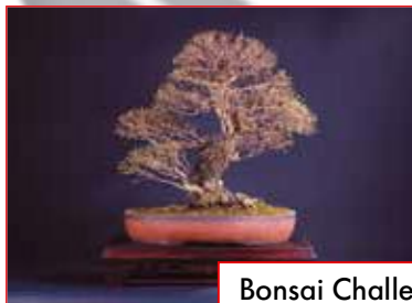
Bonsai Challenge ab Seite 114