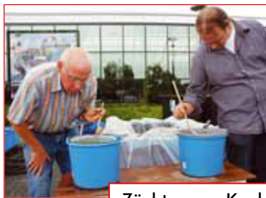
Züchter van Keulen ab Seite 80