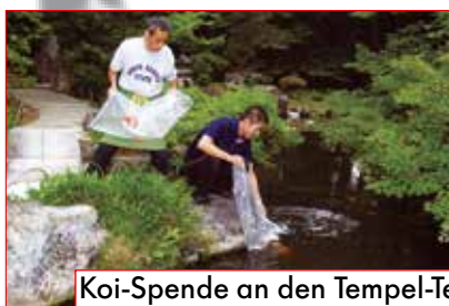
Koi-Spende an den Tempel-Teich ab Seite 90