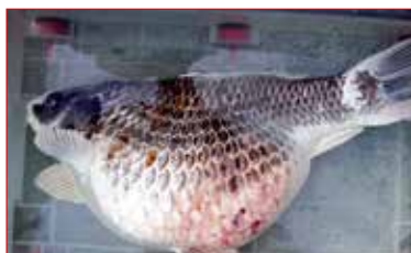
Risikofaktoren für Bauchhöhlentumore ab Seite 62