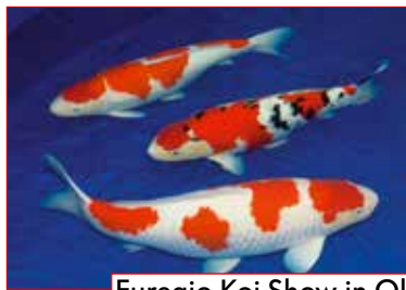
Euregio Koi Show in Oldenzaal ab Seite 28