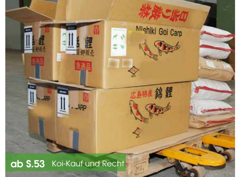
ab S.53 Koi-Kauf und Recht