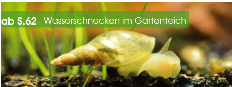
ab S.62 Wasserschnecken im Gartenteich