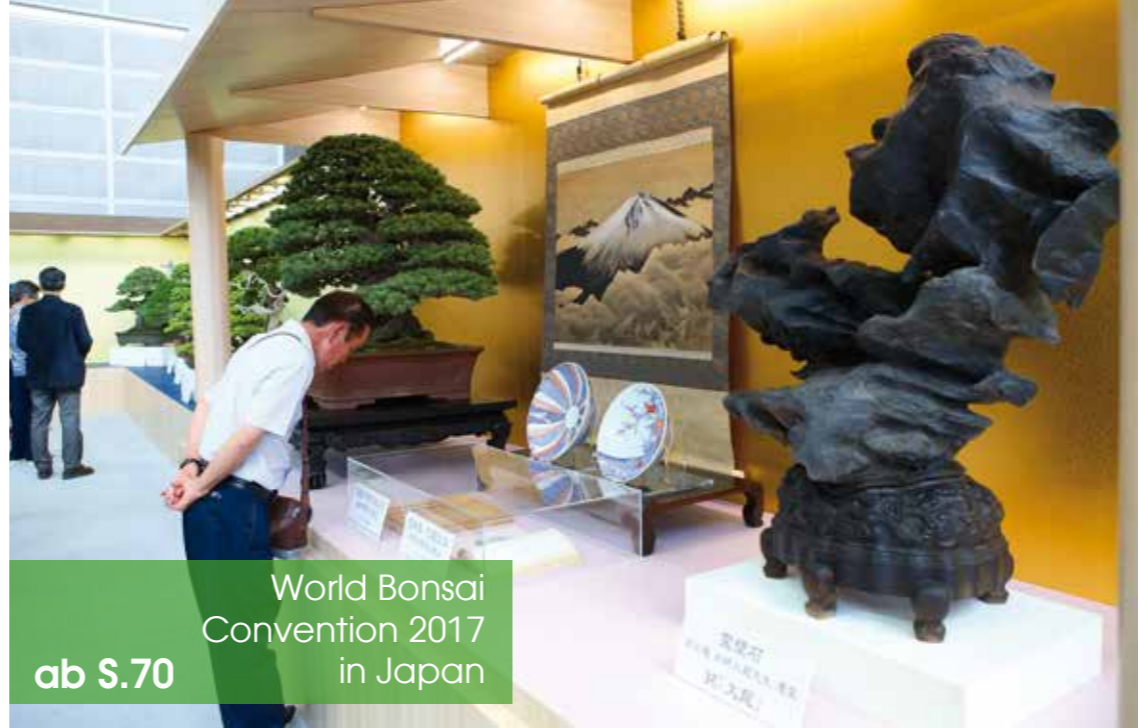
World Bonsai Convention 2017 in Japan ab S.70