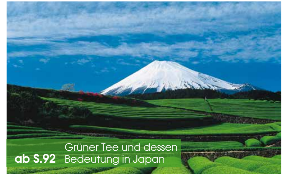
Grüner Tee und dessen Bedeutung in Japan ab S.92