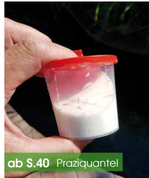
ab S.40 Praziquantel