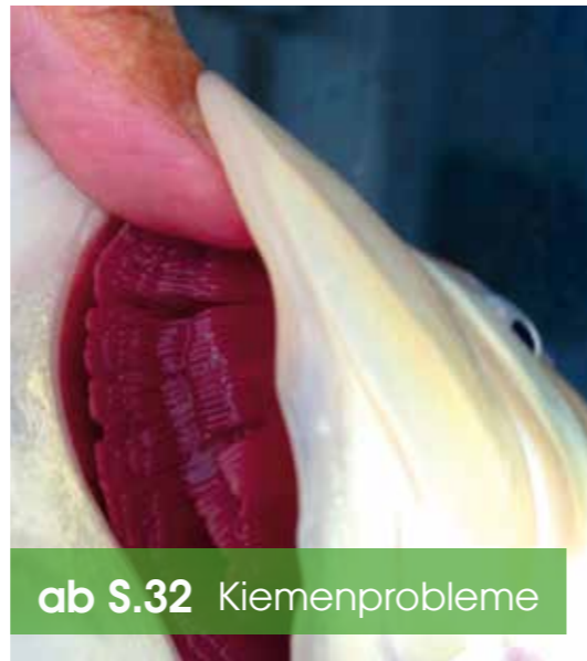
ab S.32 Kiemenprobleme