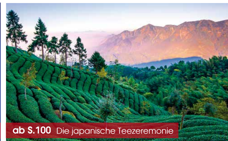
ab S.100 Die japanische Teezeremonie