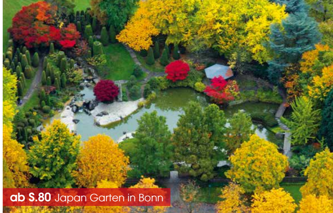
ab S.80 Japan Garten in Bonn