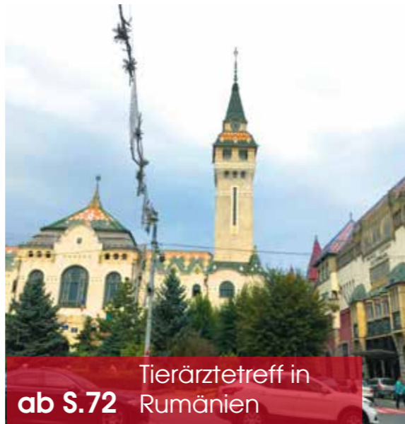
ab S.72 Tierärztetreff in Rumänien