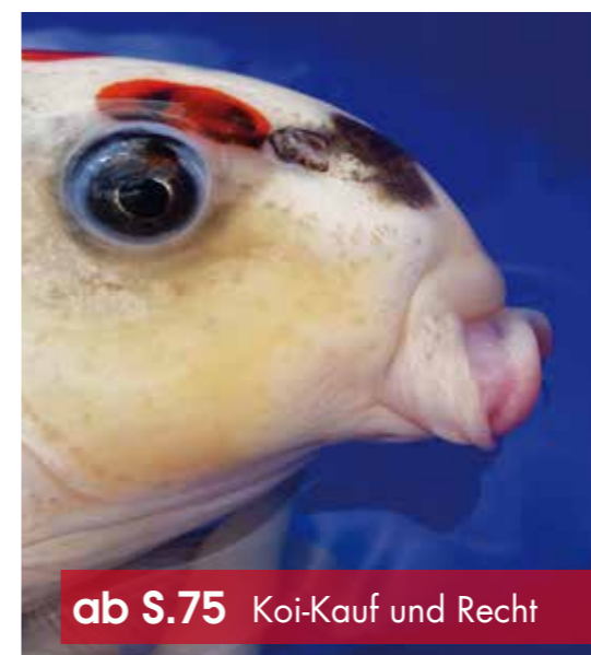
ab S.75 Koi-Kauf und Recht