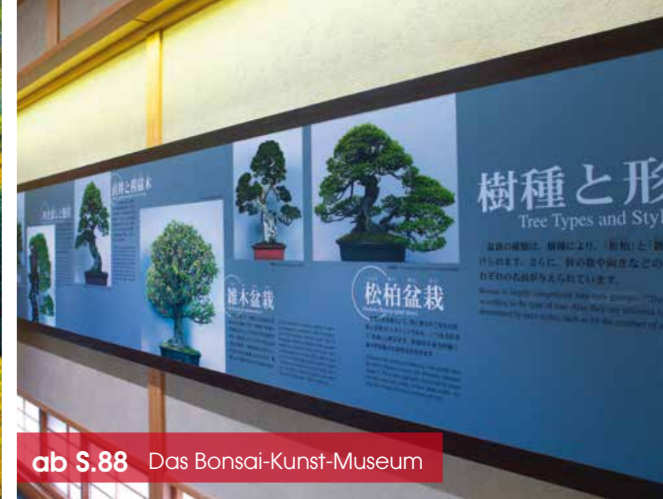
ab S.88 Das Bonsai-Kunst-Museum