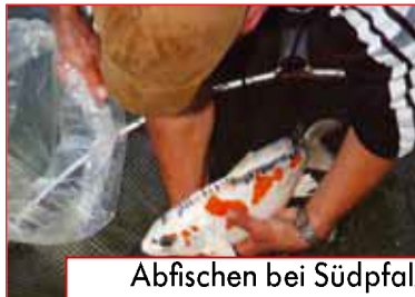
Abfischen bei Südpfalz-Koi ab Seite 40