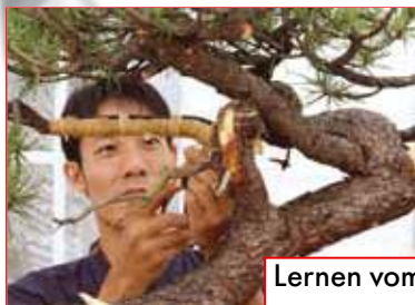
Lernen vom Bonsai-Meister ab Seite 98