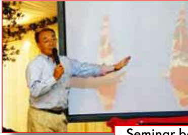
Seminar bei Koifarm ND ab Seite 34